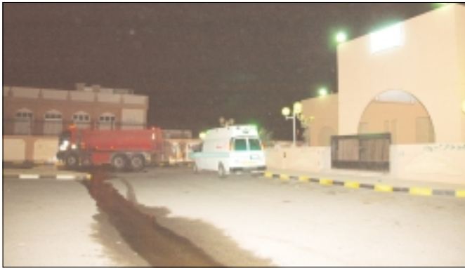
سيارات الإطفاء امام المتسوت

■ أعلنت الادارة العامة للمرور انه سيتم إغلاق طريق جمال عبدالناصر من تقاطع الدائري الثاني حتى جسر الخيطان وسيكون الاغلاق لمدة خمس ساعات مستحوط النسيم ووجود اصابات وانتقال رجال الأمن والإطفاء والإسعاف اتضح ان الحريق اندلع في حاوية القمامة وجرى اخمادها وتبين بان حسان خلف مجلس الامة اعتباراً من فجر السبت.