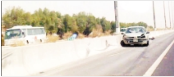
الركبة كادت بعد اصطدامها على الرام

من قبل فني الطوارئ الطبية إلى مستشفى الجهراء لتلقي العلاج. وعلی طريق الدائري الرابع أصيب مواطن في العقد الثالث من عمره بأصابات متفرقة في الجسد إثر وقوع حادث تصادم ثنائي وتم إسعافه من قبل فني الطوارئ الطبية إلى مستشفى الجهراء لتلقي العلاج. كما وقع حادث تصادم ثنائي على طريق الدائري الرابع مقابل جسر امغرة اسفر عن إصابة اثنى عشر بجرح متفرقة في جسده وتم إسعافه بواسطة فني الطوارئ الطبية إلى مستشفى الجهراء للعلاج. وفي منطقة القطناص أصيب مواطنان بجروح متفرقة في جسدتهما إثر وقوع حادث تصادم مركبتيين على طريق الدائري السادس والسرعة اسفر عن إصابة مواطن ونعاسي الجروح متفرقة في جسدتهما وتم إسعافهما