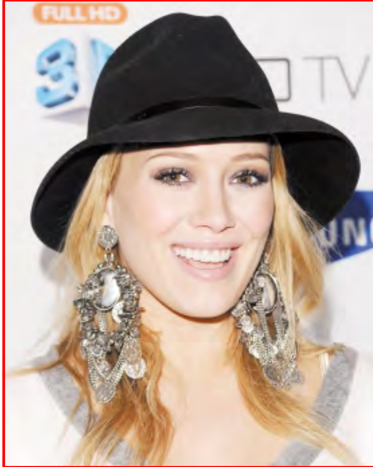
الممثلة والخفية الأميركية هيلاري داف وقعت عقدا لتأليف روايتها الخيالية الأولى الموجهة للشبان التي ستحمل عنوان الأكسير وستنشرها دار سايمون وشاسير في أكتوبر