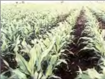
■ من حق النبات استصلاح الأرض لنموه ونباتاته