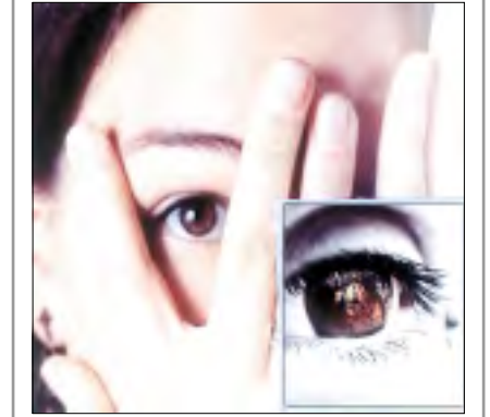
■ النظرة آثار خطيرة سيئة على أجهزة الجسم المختلفة