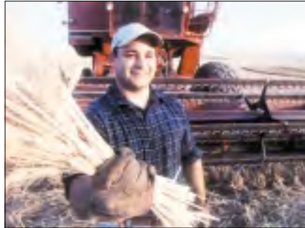
■ حق الحق في الريعية والعناية وإخراج زكاته