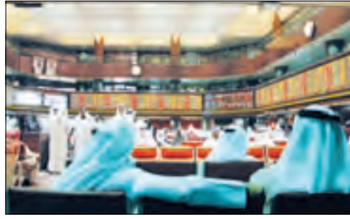
السوق يتفاعل إيجابياً مع المتغيرات الاقتصادية