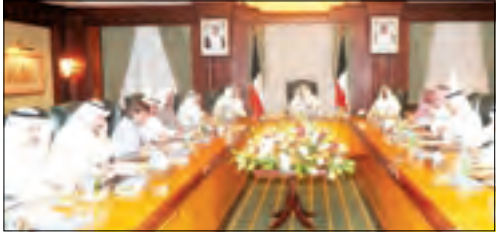
سمو رئيس مجلس الوزراء الشيخ ناصر محمد مرتشاً الجلسة الاستثنائية

بساهمون في تمويل الأونروا التي تقول انه على العكس من ذلك فانهم يساهمون بحسنة وبكرم كبيرين مضياً ان يادرو سمو أمير دولة الكويت الشيخ صباح الامد الجابر الصباح بعد مبلغ 34 مليون دولار كاملاً عقب انتهاء العمليات العسكرية الإسرائيلية في غزة في شهر يناير من عام 2009 في يادرة كريمة جداً تستحق الإشادة والتناء واخذوا باعتبارها وعد دبلوماسي على الرغم من العري.