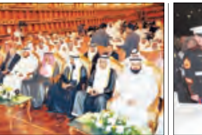
وزير الخارجية ونواب وشخصيات في مظلة الحضور