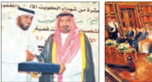
الشيخ محمد الصباح يطلق نداءً تكريماً في الكندرية

عقد مجلس الوزراء اجتماعاً استثنائياً صباح امس في قصر السيد برئاسة سمو الشيخ ناصر محمد رئيس مجلس الوزراء. وقد حرس وزير الدولة للشؤون الخارجية وعضو المجلس الوطني ان هذا الاجتماع قد خصصت اجابته الخطوط التوجيهية لخطة الخمسية الأولى والخطة السنوية حيث استمع المجلس الى عرض تفصيلي قدمه كل من نائب رئيس مجلس الوزراء للشؤون الاقتصادية ووزير الدولة لشؤون التنمية وزير الدولة لشؤون الأعمال الشيخ احمد الفهد ورئيس جهاز متابعة الأداء الحكومي الشيخ محمد السعيد المبارك وامين عام المجلس الأعلى للتخطيط والتنمية الدكتور عادل الوفايان تم خلاله شرح الخطوات التي تم اتخاذها في المجال التنفيذي للخطط الخمسية والسوية وذلك انسجاماً مع مقتضيات القانون رقم 9 لسنة 2010 الصادر بقانون الخطة الخمسية. حيث شردها المجلس ضامنين مشروعات الخطة وعدها 798 مشروعاً بتكلفة اجمالية قدرها 4,788 مليار دينار كويتي منها المشروعات الداعمة والمشروعات التنفيذية والبرامع التنفيذية لإنجازها وبرامعها الزمنية. وظام المجلس على تصورات الأمانة العامة للمجلس الأعلى للتخطيط والتنمية في شأن تجسيد مشاريعها كآلية العمل على الخطة ولا سيما فيما يتعلق بمتابعة الخطة وضمان حسن الأداء وفق أعلى درجات الشفافية والوضوح في كافة الإجراءات والمخططات وتحقيق التنسيق الأمثل بين الجهات المعنية وصولاً لإنجاز الخطة في الحدو الأمل وتحقيق غاياتها وأهدافها الوطنية.