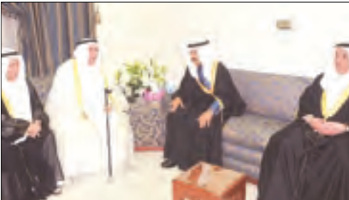
■ الامير خليفة في حديث ودي في ديوان العالم