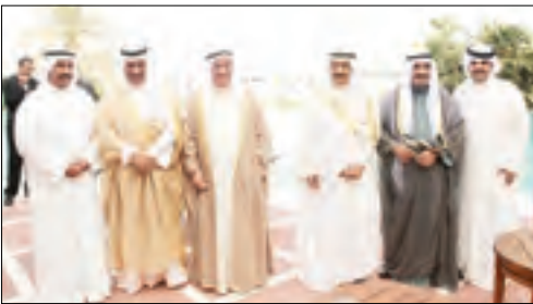
■ الامير خليفة متوسطاً سمو الشيخ ناصر الحمد ومحمد بن مبارك والفائق الاول ومبارك جابر الامد