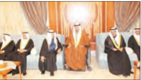
■ رئيس المجلس الوطني سمو الشيخ سالم العلي مستقبلاً الامير خليفة بن سلمان