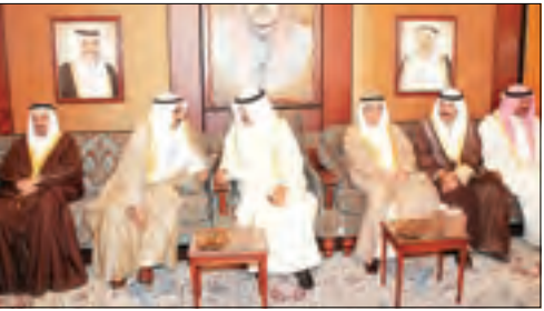
■ جانب من زيارة الامير خليفة بن سلمان لديوان الشيخ حمود الناصر

■ قام صاحب السمو الملكي الامير خليفة بن سلمان آل خليفة رئيس مجلس الوزراء بمملكة البحرين الشقيقة خلال زيارته الرسمية لدولة الكويت بجولة على الدواوين الكويتية في بادئة جسدت عمق الروابط الاضوية التاريخية بين الشعبين الشقيقين. واستقبل صاحب السمو الملكي الامير خليفة بن سلمان جولة بزيارة ديوان سمو الشيخ سالم العلي ورئيس المجلس الوطني للاطمئنان على صحة سموه حيث اعرب عن تمنياته له بموفق السحة والعافية. وشملت الجولة زيارة دواوين كل من الشيخ مبارك عبدالله الامد الصباح والشيخ فيصل حمود الصباح والشيخ مبارك جابر الامد الصباح والغنام والبدر والصقر والفانم والسردان والروضان. وتم تبادل تناول الاصايد الودية والتأكيد على المشاعر الصادقة والتضحية التي يكنها أبناء الكويت لاشقائهم في مملكة البحرين. وكانت "السياسة" نشرت خلال زيارة سمو الامير خليفة بن سلمان الرسمية وقائع زيارة سموه الى كل من قصر المسيلة حيث استقبل سموه وزير الخارجية الشيخ محمد الصباح والشيخ احمد صباح السالم وزيارته الى ديوان الشيخ جابر العبدالله بالإضافة الى زيارته الى دار "السياسة".