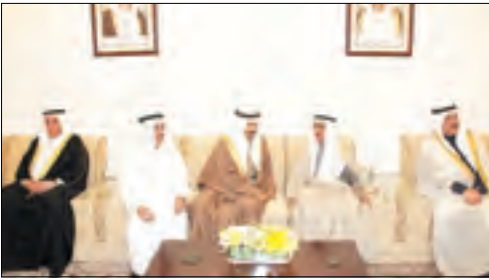
■ رئيس وزراء البحرين في ضيافة ديوان السردان

■ قام صاحب السمو الملكي الامير خليفة بن سلمان آل خليفة رئيس مجلس الوزراء بمملكة البحرين الشقيقة خلال زيارته الرسمية لدولة الكويت بجولة على الدواوين الكويتية في بادئة جسدت عمق الروابط الاضوية التاريخية بين الشعبين الشقيقين. واستقبل صاحب السمو الملكي الامير خليفة بن سلمان جولة بزيارة ديوان سمو الشيخ سالم العلي ورئيس المجلس الوطني للاطمئنان على صحة سموه حيث اعرب عن تمنياته له بموفق السحة والعافية. وشملت الجولة زيارة دواوين كل من الشيخ مبارك عبدالله الامد الصباح والشيخ فيصل حمود الصباح والشيخ مبارك جابر الامد الصباح والغنام والبدر والصقر والفانم والسردان والروضان. وتم تبادل تناول الاصايد الودية والتأكيد على المشاعر الصادقة والتضحية التي يكنها أبناء الكويت لاشقائهم في مملكة البحرين. وكانت "السياسة" نشرت خلال زيارة سمو الامير خليفة بن سلمان الرسمية وقائع زيارة سموه الى كل من قصر المسيلة حيث استقبل سموه وزير الخارجية الشيخ محمد الصباح والشيخ احمد صباح السالم وزيارته الى ديوان الشيخ جابر العبدالله بالإضافة الى زيارته الى دار "السياسة".