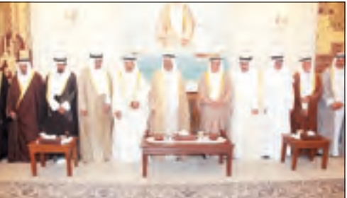
■ ال الروضان في استقبال ضيف الكويت الامير خليفة بن سلمان وبدا الشيخ علي الجابر