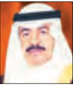
■ الأمير خليفة بن سلمان آل خليفة

بعث سمو الأمير الشيخ صباح الامد ببرقية تعزية الى خادم الحرمين الشريفين الملك عبدالله بن عبدالعزيز آل سعود عبر فيها عن تألم وتعبه وصداق مواساته بوفأة المغفور لها باله الله تعالى الأميرة شيخة بنت عبدالرحمن آل سعود سائلاً المولى العالی ان يتغمدها بواسع رحمته ويسكنها فسيح جناته وان يلهم الأسرة المألقة جميل الصبر وحسن العزاء. كما بعث سمو ولي العهد الشيخ نواف الامد وسمو رئيس مجلس الوزراء ناصر الحمد ببرقيتي تعزية مماثلتين.