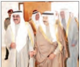
■ الشيخ مبارك عبدالله الامد مرحباً برئيس الوزراء البحريني