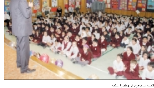
الطلبة يستمعون إلى محاضرة بيئية

نظمت شركة شل الكويت أخيرا ورش عمل حملت شعار "تقليل الانبعاثات، إعادة الاستخدام والتدوير" لتنشر التوعية البيئية بين طلبة المدرسة الإنكليزية الحديثة.