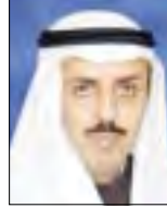
الشيخ وليد خالد الملك الصباح

الرحلة الثانية من مجمع أوتاد التجاري في محافظة الجبيرة وإنشاء مجمع للخدمات الطبية في منطقة شرق بجانب المستشفى العمري إلى جانب برج شرق فندقي في نفس المنطقة. وأضاف أن الشركة انجزت مشروع مجمع أوتاد في مركز القطيف الإداري والذي يستعمل على مجمع تجاري راق بصحت مسكوي للمجمعات التجارية ورج إداري في منطقة العقيلة. وأوضح أن الشركة باشرت بتسويق المجمع والبرج الإداري.